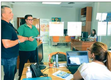
Oficina del programa Orienta en la Casa de la Cultura de Almuñécar. FC

El presidente de la Mancomunidad de Municipios de la Costa Tropical de Granada, Rafael Caballero, visitó la oficina del programa Orienta, donde la institución comarcal ofrece orientación y asesoramiento curricular y laboral a desempleados, con "el objetivo de conseguir su reinserción laboral y su orientación hacia la formación en sectores que requieran empleados".