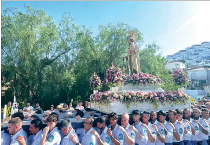
Momento de la procesión de la Virgen del Carmen de Almuñécar, patrona de los marineros.

La Virgen del Carmen volvió a llenar el pasado 16 de Julio los corazones de la Costa.