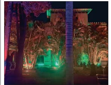
Palacete de La Najarra, sede del Patronato de Turismo. FC

70 puntos de luz led iluminan la sede del Patronato de Turismo sexitano que, además, servirán para celebraciones y reivindicaciones.