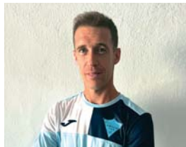
Goku Centro del campo