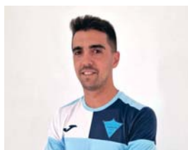
Salvador Triviño Central