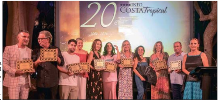
Foto de familia de los premiados.