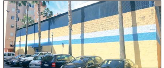
Exterior del polideportivo de La Carrera. FC

Con un presupuesto de 69.353,04 euros y 3 meses para la ejecución de las obras, las empresas interesadas pueden presentar ya sus ofertas al ayuntamiento.