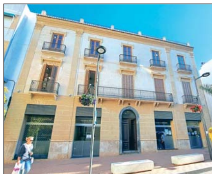
Sede de la Mancomunidad de Municipios de la Costa Tropical.