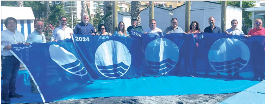
Los responsables de las playas sexitanas muestran las Banderas Azules que ya ondean en las playas de Almuñécar y La Herradura.

Estos distintivos tienen en cuenta la calidad del agua y los arenales, los baños, las duchas, el servicio de socorrismo, la accesibilidad y los puestos de socorro, entre otros servicios.