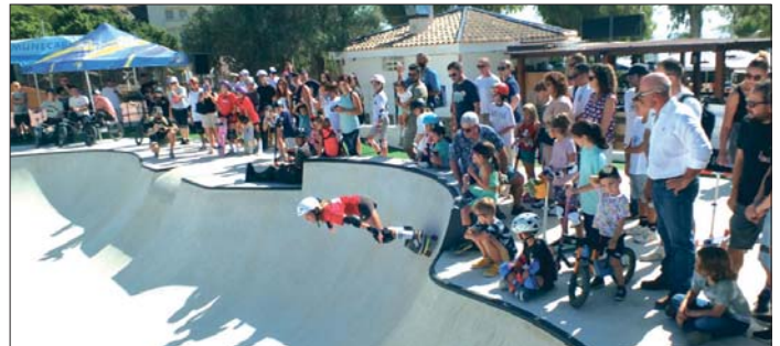
Los aficionados contemplan una de las primeras exhibiciones en el Skate Park

Antes de dar paso al concejal de Deportes, el alcalde sexitano ha argumentado que, "más allá de las rampas y los saltos, este es un lugar de encuentro, un lugar de convivencia, un lugar para disfrutar de nuestra ciudad, y esto es solo el comienzo. Porque Almuñécar no deja de avanzar, de crecer, de cumplir sus sueños. Este skate park es vuestro, es para vosotros".