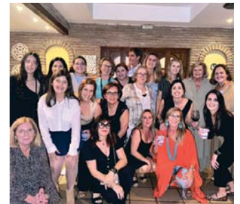
Las mujeres Guidet.

punto de que en el pueblo de Nerja era un secreto a voces que el militar veterinario estaba en la sierra de Frigiliana. No lo encontraron, ni primero la policía militar francesa ni luego las tropas españolas.