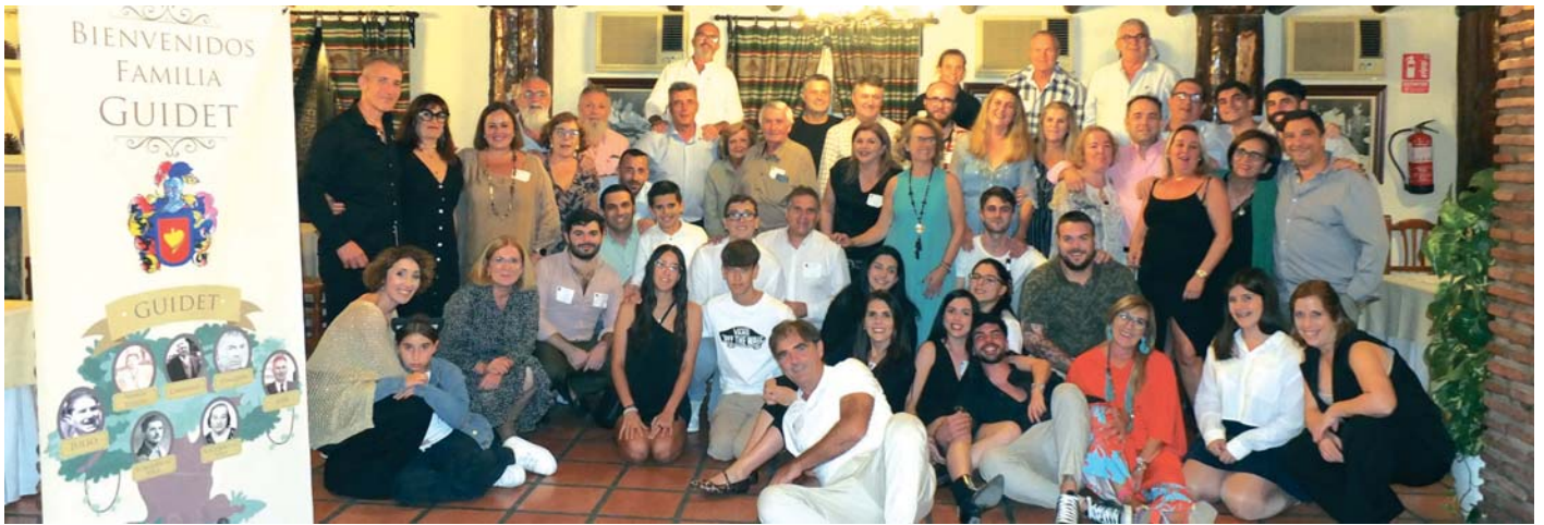
Foto de familia.

Tras muchos intentos, la familia Guidet, con todas sus ramificaciones en Almuñécar, Motril, Almería y Málaga, ha compartido una tarde noche juntos y han comenzado a elaborar su árbol genealógico, que se remonta a un capitán veterinario del ejército de Napoleón, durante la invasión de los franceses.