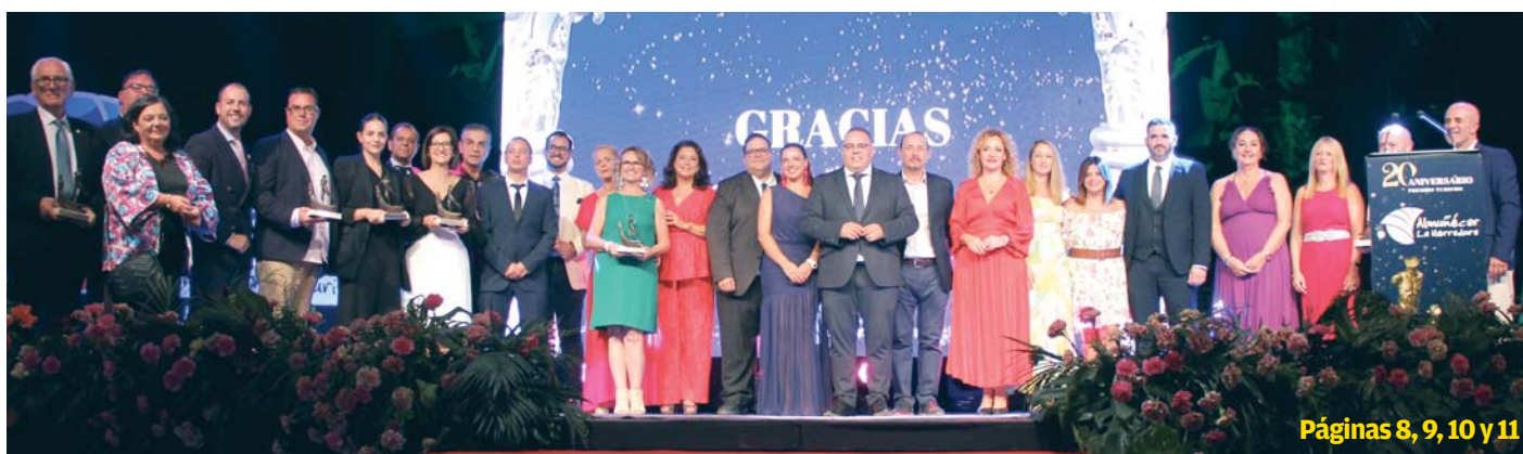
Páginas 8, 9, 10 y 11