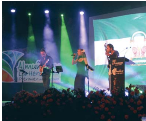
Momento de la interpretación del Himno de Andalucía.

La gala, guiada por la presentadora y directora de VIVA Almuñécar-La