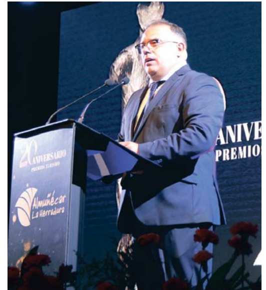
El alcalde de Almuñécar, durante su intervención.