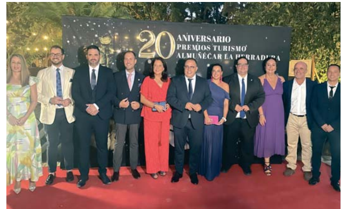
El equipo de Gobierno posa en el 'photocall' antes de empezar la gala.