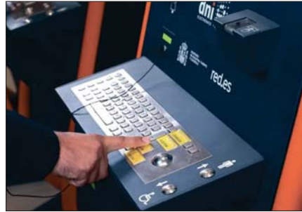
La máquina se ubicará en la Oficina de Atención al Ciudadano. FC

El pleno del Ayuntamiento de Almuñécar ha aprobado el convenio firmado entre el consistorio sexitano y la Dirección General de la Policía Nacional, para la instalación, en la Oficina de Atención al Ciudadano, de un Puesto de Actualización de Documentación de los certificados electrónicos del DNI.